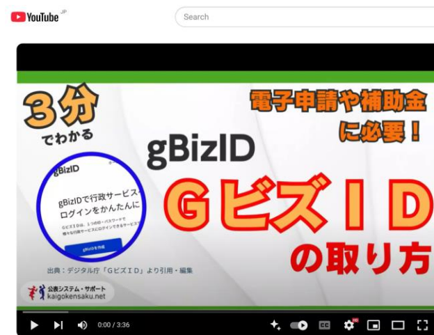
動画：ステップ1 GビズID