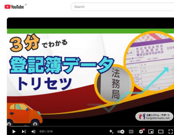
動画：ステップ2 登記簿データ